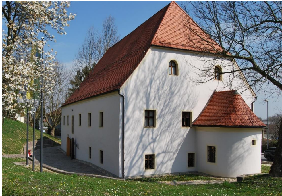
Obnovljeni Špital je danes radgonski muzej

Mostove najdemo tudi v drugih manj otipljivih vlogah. Spomin in narodno kulturno zavednost Gornje Radgone simbolno premošča muzej v Špitalu na Majstrovem trgu. Ta stavba izvira iz davnega 14. stoletja. Večjo nadgradnjo je doživela leta 1614, nato pa še eno leta 1764. Objekt predstavlja redek primer meščanske arhitekture in ima edinstveno tlorisno zasnovo in ostrešje. Na začetku 2. tisočletja je bila stavba v celoti prenovljena, s čimer je odprla vrata tudi muzejska zbirka Radgonski mostovi. Tukaj lahko današnji Radgončani in obiskovalci interaktivno odkrivajo povezave s svojimi arheološkimi, etnološkimi, umetniškimi in geološkimi koreninami.