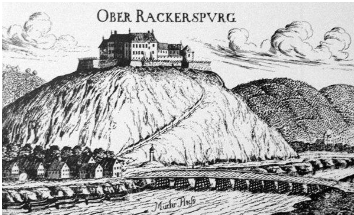
Gornja Radgona v poznem srednjem veku

Ob obisku Gornje Radgone takoj postane očitna dvojnost naselbine. Slovenska Gornja Radgona je nastala že v neolitiku na pobočju Grajskega griča. Po ustanovitvi Radgone (Bad Radkersburg) leta 1265 na nasprotnem bregu, pa je Gornja Radgona postala obrambno predmestje. Zaradi strateške lege je oba kraja povezovalo pomembno mostišče, po katerem so večkrat zatopotali vojaški škornji, a še bolj je služilo povezovanju dveh različnih etničnih in jezikovnih skupnosti, ki že od časov poselitve sobivata na tem območju.