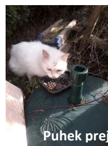
Puhek prej in potem