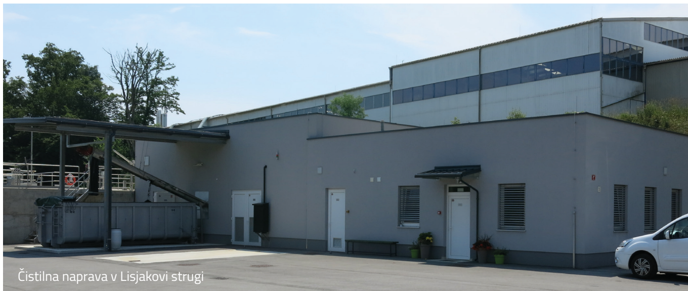
Čistilna naprava v Lisjakovi strugi