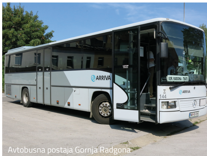
Autobusna postaja Gornja Radgona

Občina Gornja Radgona ima s podjetjem Arriva d.d. iz Maribora sklenjen dogovor o izvajanju javnega linijskega medkrajevnega prevoza potnikov na območju Občine Gornja Radgona, v okviru katerega prevoznik opravlja tudi šolske prevoze za Osnovno šolo Gornja Radgona in Osnovno šolo dr. Antona Trstenjaka Negova.