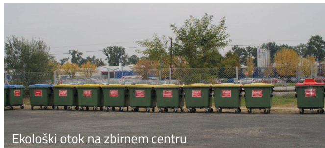
Ekološki otok na zbirnem centru

V preteklosti je bilo kar nekaj pritožb glede pobiranja odpadkov iz ekoloških otokov in urejenosti le-teh. Veliko ekoloških otokov je lociranih ob glavnih in zelo prometnih cestah. Ravno te lokacije pa so zelo privlačne za »divje odlaganje«. Žal naša ekološka zavest še ni na zelenem nivoju, saj so Ekološki otoki namenjeni izključno odlaganju določenih vrst odpadkov, ki se jih lahko reciklira.