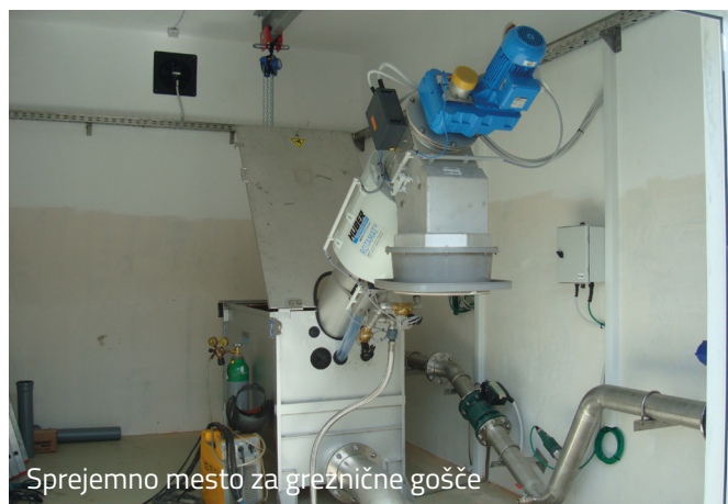
Sprejemno mesto za greznične gošče

Sestavljena je iz omrežnine CČN in cene storitve.