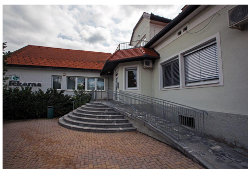
Zdravstvena postaja Sv. Jurij ob Ščavnici