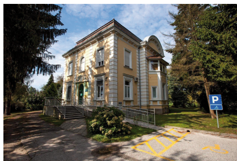
Zdravstvena postaja Apače