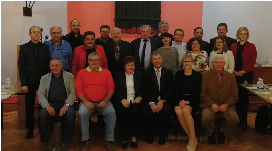
Članice in člani občinskega sveta – konstitutivna seja (20. december 2018)

Na podlagi preteklih rednih lokalnih volitev v letu 2018, se je konstituiral in začel delovati občinski svet v novem sklicu. Imenovan je bil nadzorni odbor občine, ki se je že konstituiral in pričel z delom, imenovala in z delom pričela pa so tudi delovna telesa občinskega sveta – odbori in komisije. Seznam članic in članov občinskega sveta ter seznam članic in članov delovnih teles občinskega sveta je objavljen na uradni spletni strani občine www.gor-radgona.si (Organi občine | Občinski svet).