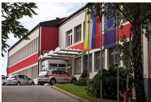
Zdravstveni dom Gornja Radgona