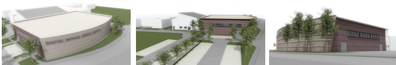
Vizualizacija VŠD Gornja Radgona

Sočasno pa se izvajajo še druge aktivnosti in iskanje optimalnih rešitev vezane na izgradnjo športne dvorane in njeno opremo.