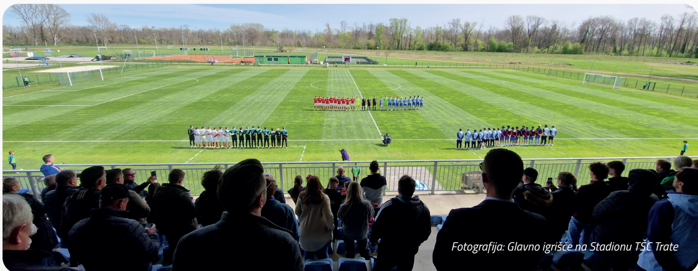
Fotografija: Glavno igrišče na Stadionu TŠC Trate