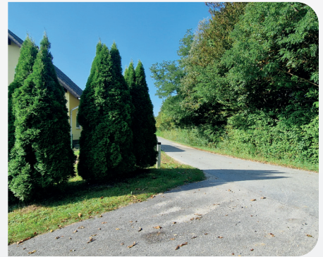
Slaba preglednost v križišču in veje nad voziščem