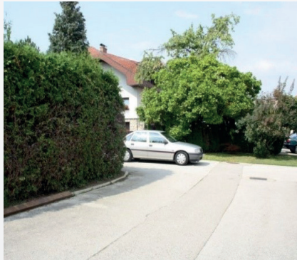
Oviranje preglednosti v križišču