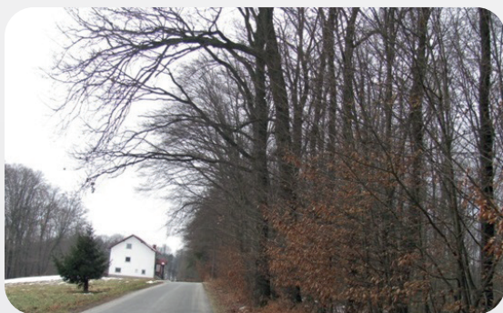
Nevarne veje nad voziščem

V zadnjem obdobju je vse več nepredvidljivega vremena in močnega vetra, posledično pa obstaja večja verjetnost, da bo na javno cesto padlo kakšno drevo ali veja in s tem ogrozilo varnost udeležencev v cestnem prometu. Zato bi lastnike gozdov in druge vegetacije želeli seznaniti z nekaterimi določili Zakona o cestah. Ta namreč v skladu s prvim odstavkom 5. člena, prepoveduje izvajati ali opustiti kakršna koli dela na javni cesti, na zemljiščih ali na objektih ob javni cesti, ki bi lahko škodovala cesti ali ogrožala, ovirala ali zmanjšala varnost prometa na njej. V to kategorijo spadajo tudi drevesa. Cestni svet je zemljišče, katerega mejo na podlagi predpisov o projektiranju javnih cest določajo linije med skrajnimi točkami prečnega in vzdolžnega profila cestnega telesa, vključno z napravami za odvodnjavanje.