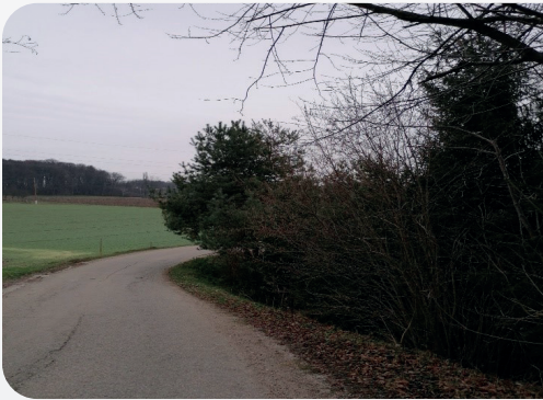
Oviranje preglednosti v ovinku

Z vidika varnosti udeležencev v cestnem prometu pozivamo vse imetnike živih mej in trajnih nasadov oziroma vegetacije ob javnih cestah, da le te vzdržujejo na način, kot predpisuje zakon, pred zasaditvijo pa si ta tovrsten poseg pridobijo soglasje s strani upravljavca občinske ceste – Občinske uprave Občine Gornja Radgona.