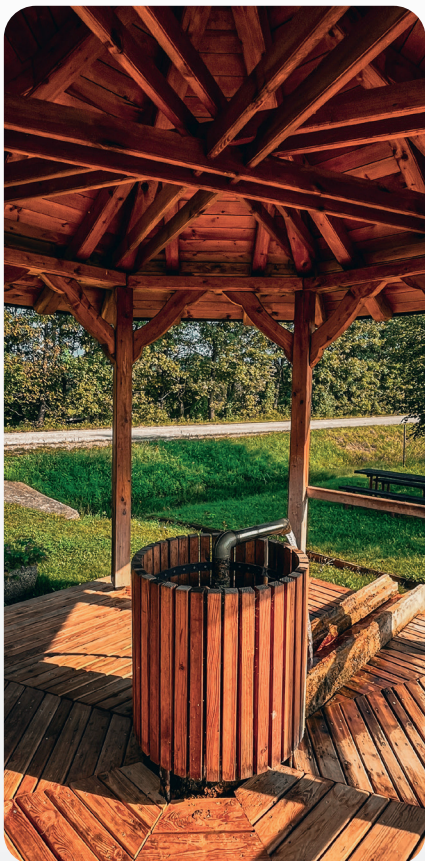
Ivanjševska slatina drugi vrelc

Izviri mineralne vode (slatine) termalne vode in mofete so edinstvene naravne dobrine območja naše občine. Izjemen potencial teh geoloških pojavov je lokalno že prepoznaven, vendar pa zaradi pomena – kot naravne vrednote – omejen za masovni turizem. Pri razvoju novih turističnih strategij in produktov, ki temeljijo na mofetah in izvirih slatin je ključno dobro poznavanje pojavov ter iskanje pravega ravnotežja med varstvom narave in kulturne dediščine ter razvojem trajnostnega turizma.