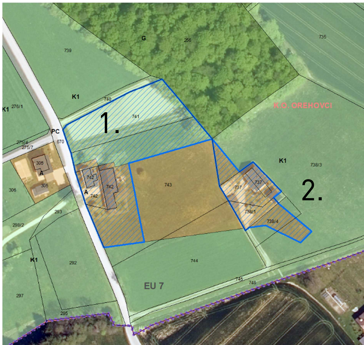
Slika 8: Prikaz novega območja posamične poselitve na izseku iz OPN in digitalnem ortofoto načrtu.