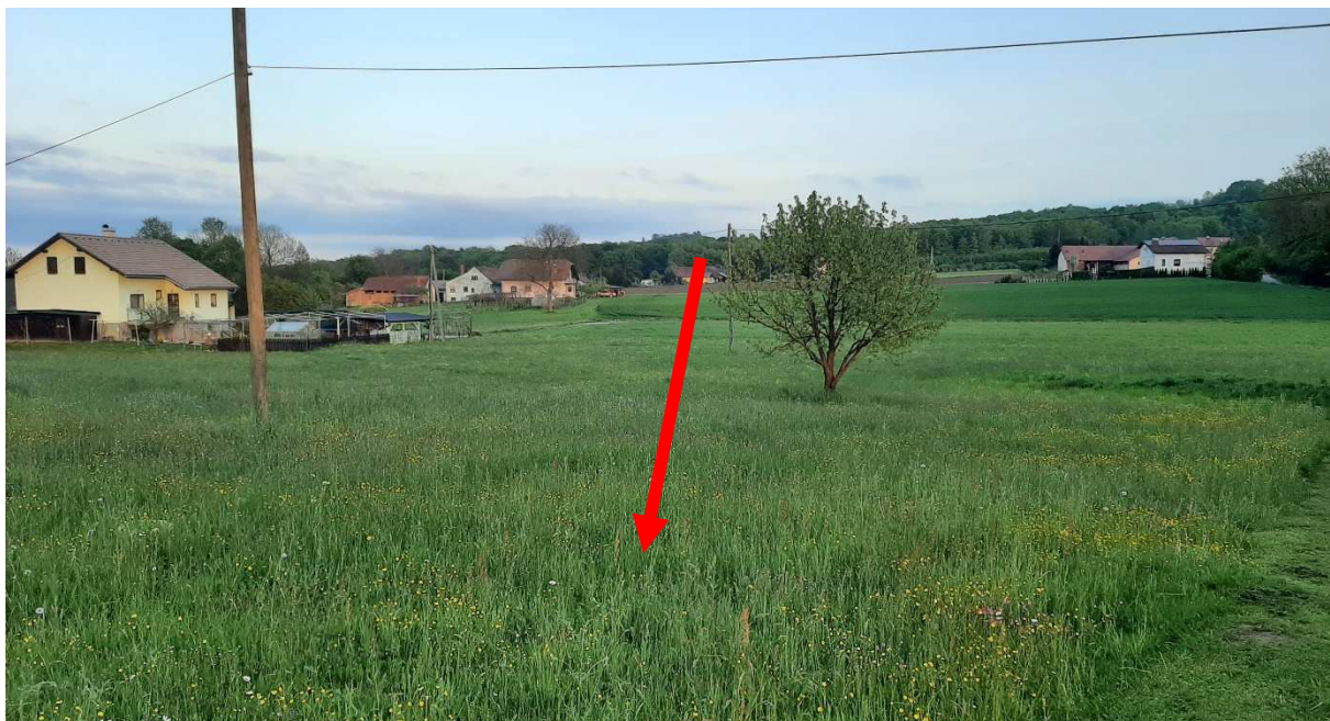
Slika 4: Prikaz območja LP, kjer je predlagan izvzem obstoječega nepozidanega stavbnega zemljišča.