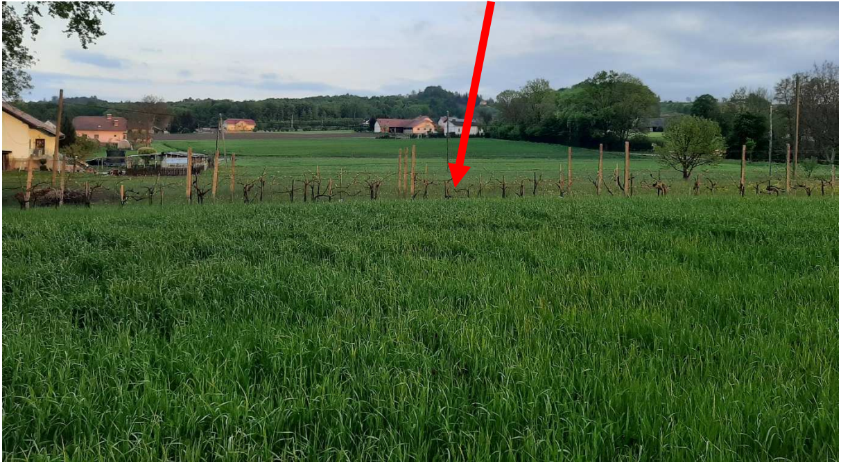
Slika 5: Prikaz območja LP, kjer je predlagan izvzem obstoječega nepozidanega stavbnega zemljišča, s prikazom padca terena.