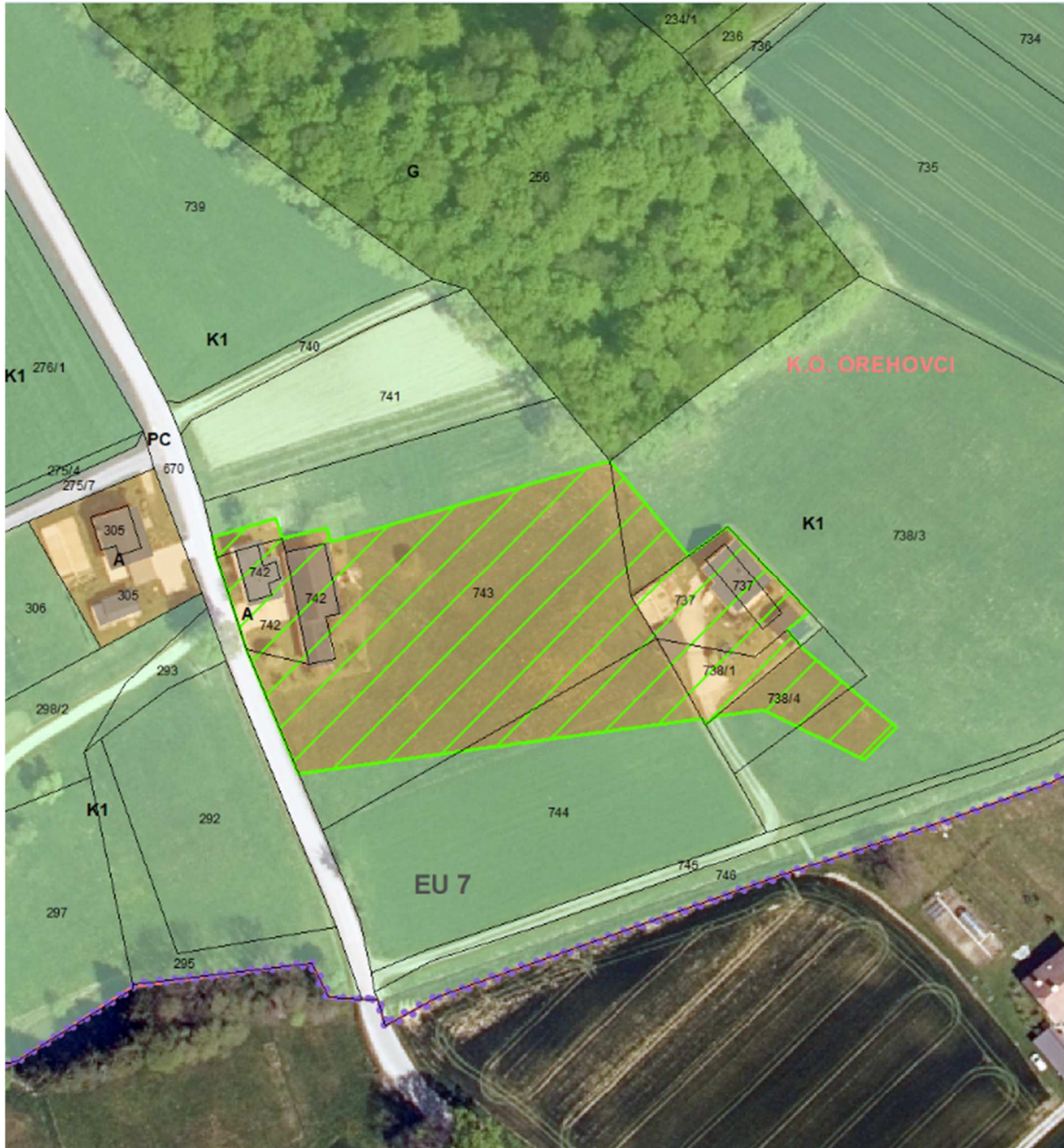
Slika 1: Prikaz izvornega območja LP na izseku iz OPN in digitalnem ortofoto načrtu.