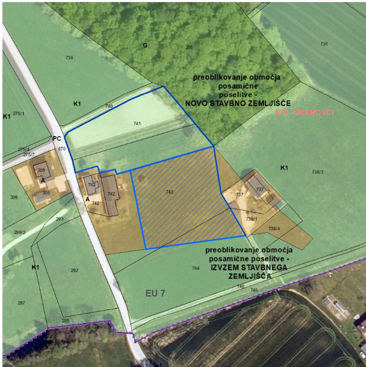
Slika 2: Prikaz območja LP na izseku iz OPN in digitalnem ortofoto načrtu.