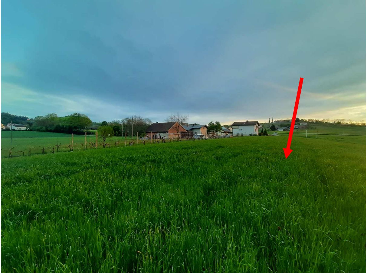
Slika 7: Prikaz območja LP, kjer je predlagana preselitev stavbnega zemljišča.