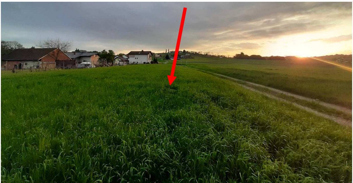
Slika 6: Prikaz območja LP, kjer je predlagana preselitev stavbnega zemljišča, s prikazom odmerjene dostopne poti.