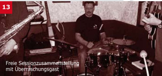
Freie Sessionzusammenstellung mit Überraschungsgast

Kartenpreise: VVK € 14,00 Club Raiba + e-Lugitsch + Ö1: € 13,00 AK € 17,00