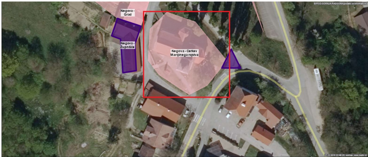
Slika 5: Osvetlitev cerkve Sv. Marije v Negovi

Za osvetlitev cerkve v Negovi so uporabljeni neustrezni reflektorji. Sama osvetlitev pa ni narejena v skladu z zahtevami. Osvetlitev je potrebno urediti v skladu z zahtevami uredbe.