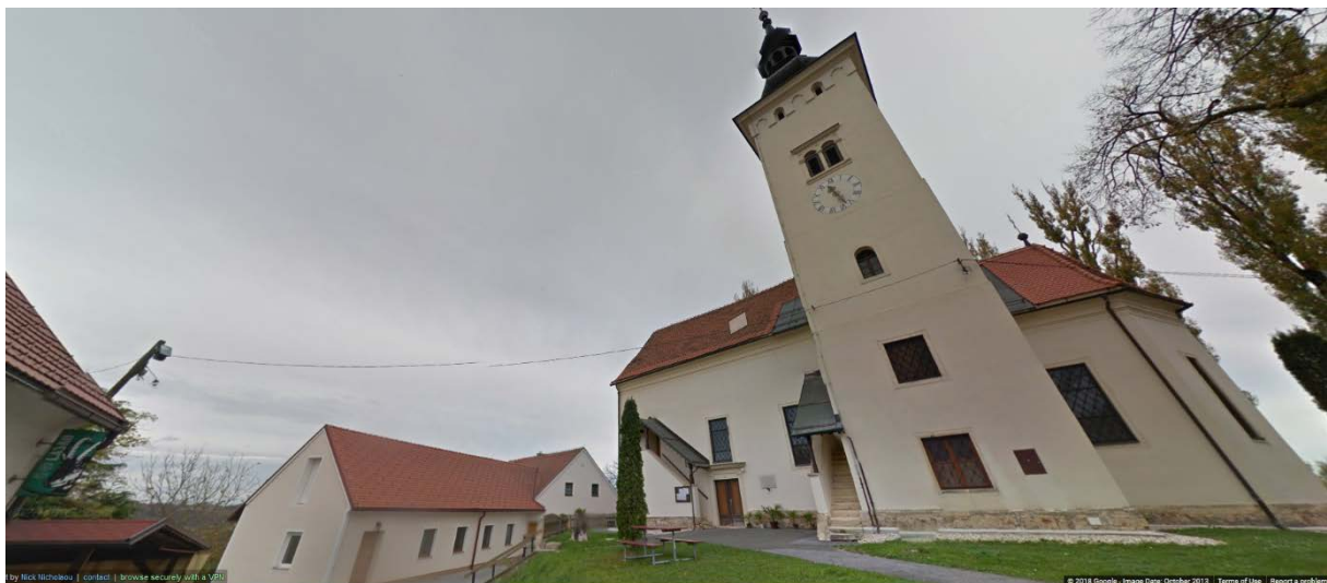
Slika 6: Osvetlitev cerkve Sv. Marije v Negovi