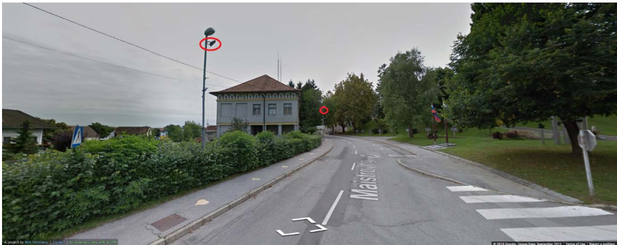
Slika 3 Osvetlitev spomenika generalu Rudolfu Maistru