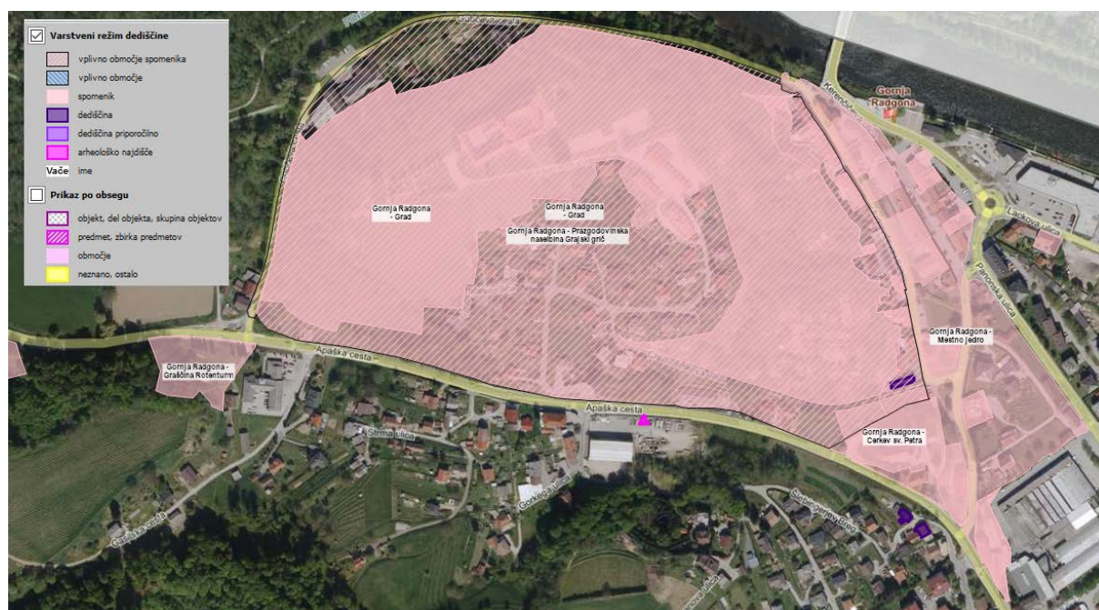
Slika 1: Kulturni spomenik in vplivno območje na Glavnem trgu

V območju kulturnega spomenika in njegovega vplivnega območja je bila v letu 2017 zamenjana večina svetilk (odjemno mesto Grajski hrib).