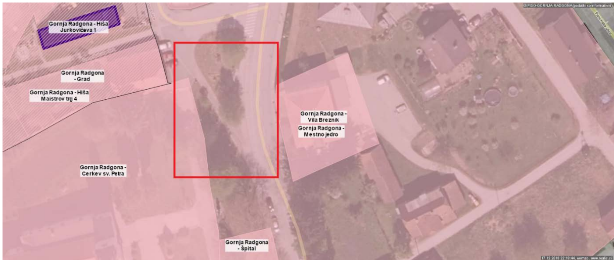
Slika 2: Osvetlitev spomenika generalu Rudolfu Maistru

Na Maistrovem trgu se nahajajo doprsni kipi, ki so osvetljeni. Območje je spada pod kulturni spomenik. Območje spomenika je prikazano na spodnji sliki. Osvetlitev je izvedena z asimetričnimi reflektorji nameščenih na stebrih JR preko ceste.