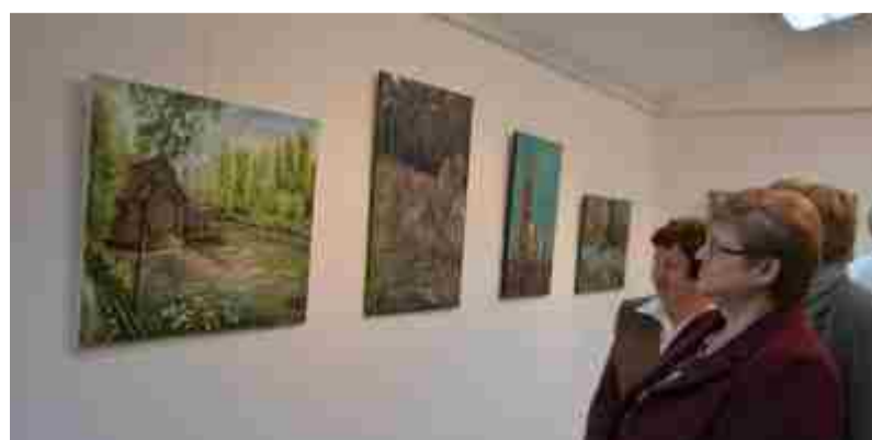
Vabljeni v galerijo Doma kulture Gornja Radgona, ki gosti likovno razstavo 444 km