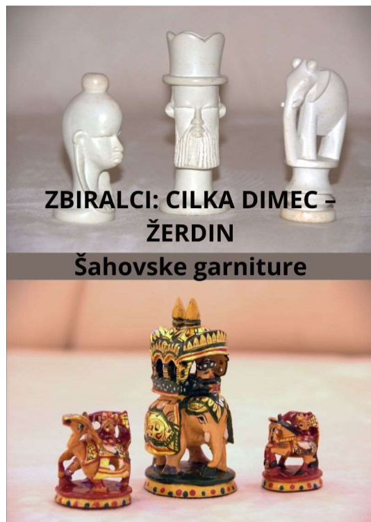
ZBIRALCI: CILKA DIMEC - ŽERDIN Šahovske garniture