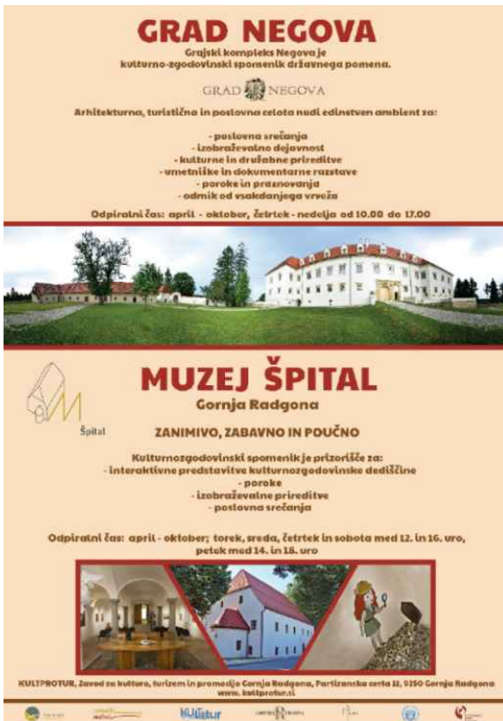
S 1. aprilom sta grad Negova in muzej Spital ponovno odprla svoja vrata in vabita med svoje zidove.