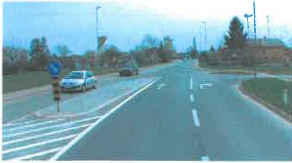
Slika 5: Pogled na tri-krako-križišče (pri Hofer-ju), pogled v smeri stacionaže.