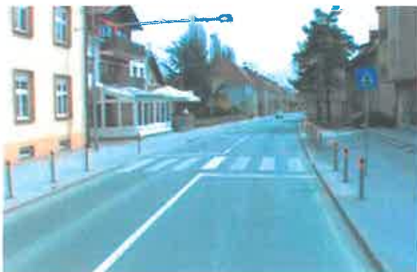
Slika 2: Pogled na prehod za pešce (pri glasbeni šoli), pogled v smeri stacionaže.