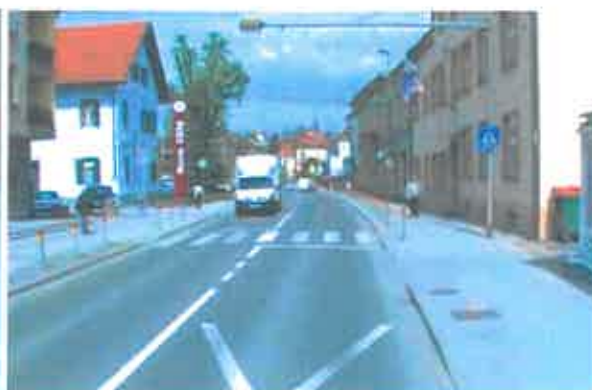
Slika 3: Pogled na prehod za pešce (pri glasbeni šoli), pogled v nasprotni smeri stacionaže.

Direkcija RS za ceste, v skladu s tehnično specifikacijo TSC 02.201 »Prehodi za pešce, Pogoji za označitev in način označitve« (osnutek, 22. november 2010, ki je v potrjevanju) na državnih cestah, ureja prehode za pešce. Za ureditev samostojnega prehoda za pešce z bičem ali za ureditev semaforiziranega prehoda za pešce, morajo biti izpolnjeni določeni kriteriji (pogoji za določitev nivoja urejanja prehodov za pešce) in sicer število pešcev in prometne obremenitve na predmetni državni cesti v konični uri.