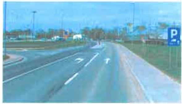
Slika 5: Pogled na tri-krako-križišče (pri Hofer-ju), pogled v nasprotni smeri stacionaže.

Glede na predvideno umestitev prehoda za pešce (v območje križišča, kjer so delno urejene površine za pešce in javna razsvetljava) ugotavljamo, da je njegova ureditev odvisna od celotne ureditve križišča in peš površin v vplivnem območju križišča.