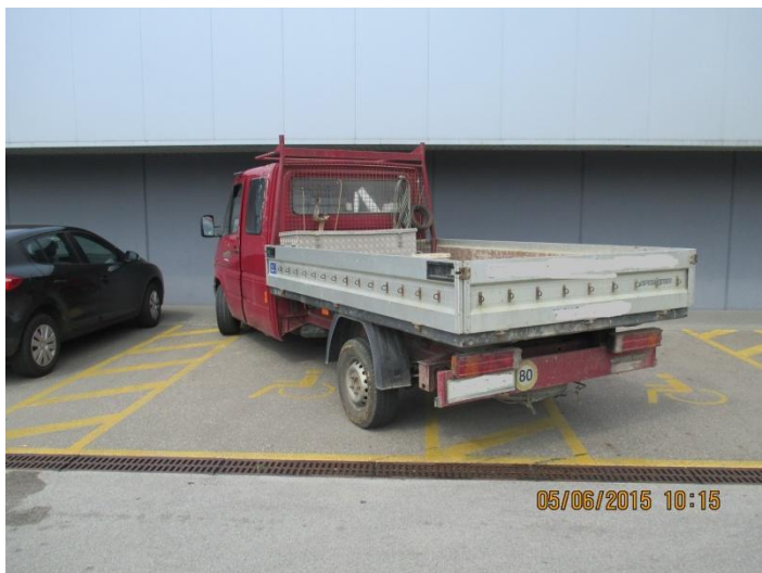
Slika 2 in 3: Primer nedovoljenega parkiranja

Na tem področju opažamo, da smo iz leta v leto uspeli zmanjšati delež prekrškov nepravilnega oz. nedovoljenega parkiranja na pločniku, parkirnih mestih za invalide ali delu ceste, kjer je prost prehod med parkiranim vozilom in neprekinjeno črto ali robom vozišča manj kot 3 metre, kar dejansko pomeni oviranje ali ogrožanje prometa oziroma onemogočanje parkiranja osebam s posebnimi potrebami. Prav tako se je občutno zmanjšalo število kršitev na delih oz. območjih, kjer je bila že večkrat postavljena samodejna merilna naprava za merjenje hitrosti.