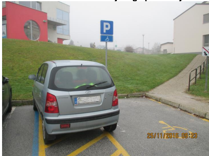
Slika 2 in 3: Primer nedovoljenega parkiranja

Na tem področju opažamo, da smo v leta iz leto uspeli zmanjšati delež prekrškov nepravilnega oz. nedovoljenega parkiranja, še posebej na pločniku, parkirnih mestih za invalide ali delu ceste, kjer je prost prehod med parkiranim vozilom in neprekinjeno črto ali robom vozišča manj kot 3 metre, kar dejansko pomeni oviranje ali ogrožanje prometa oziroma onemogočanje parkiranja osebam s posebnimi potrebami, čeprav se tovrstni prekrški še vedno pojavljajo. Prav tako se je občutno zmanjšalo število kršitev na delih oz. območjih, kjer je bila že večkrat postavljena samodejna merilna naprava za merjenje hitrosti, negativno izstopajo zgolj nekateri odseki cest na območju občine Apače.