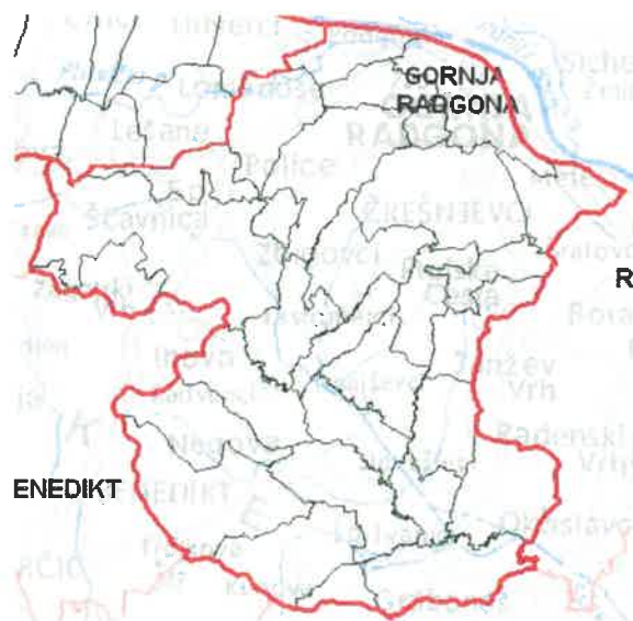
Slika 1: Območje Občine Gornja Radgona