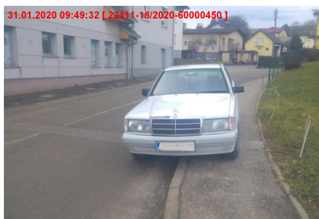
Vozilo parkirano na pločniku

Iz tega področja velja omeniti še problematiko zapuščenih vozil. Namreč v skladu s Zakonom o pravilih cestnega prometa (Uradni list RS, št. 82/13 – uradno prečiščeno besedilo in 68/16) je zapuščeno vozilo je motorno ali priklopno vozilo, parkirano na javni cesti ali na nekategorizirani cesti, ki se uporablja za javni cestni promet ali na drugi javni površini, ki ni namenjena prometu vozil in nima registrskih tablic ali ni registrirano več kot 30 dni in ni nerabno ali zavrženo motorno vozilo, ki mu je življenjska doba iztekla zaradi poškodb, starosti ali drugih razlogov in je zaradi tega postalo odpadke po merilih iz predpisa, ki ureja ravnanje z odpadki. Teh primerov je bilo v letu 2020, na območju občine Gornja Radgona kar 8, na območju občin Apače 2 in Sveti Jurij ob Ščavnici pa po 1. V primeru, da je takšno vozilo parkirano na neprometni površini ali na zasebnem zemljišču, se obravnava kot nevaren odpadke, kar je v stvarni pristojnosti državne inšpekcije za okolje.