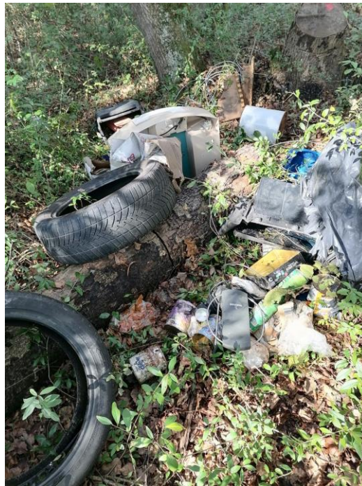
Slika 6: Primer nepravilnega odlaganja odpadkov v naravi

V to področje nadzora sodi tudi kurjenje odpadkov. Odpadkov ni dovoljeno kuriti, predajati jih je potrebno izvajalcu javne službe zbiranja in prevoza odpadkov, obvezno je tudi ločeno zbiranje posameznih frakcij in jih ločeno odložiti na ekološki otok, za plastiko, embalažo in konzerve pa je organiziran tudi odvoz neposredno od gospodinjstev. Občine ustanoviteljice skupne občinske uprave imajo na tem področju že sprejet nadstandard ravnanja s komunalnimi odpadki, saj so ukinile ekološki otoki in se vse vrste komunalnih odpadkov, z izjemo stekla na območju občine Sveti Jurij ob Ščavnici, zbirajo in odvažajo neposredno od gospodinjstev, v občini Gornja Radgona in Apače pa jih je možno tudi brez dodatnega plačila odložiti na zbirnem centru.