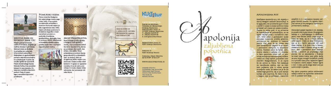
Zloženka Apolonijina pot v slovenskem, nemškem in angleškem jeziku

Nadaljevali smo s promocijo in trženjem turistične pridobitve oz. produkta: Apolonijina pot. Turistična pot, po kateri se je mogoče peljati z avtomobilom, z avtobusom ali pa s kolesom, je mišljena kot sestavljanka, kjer si obiskovalec iz brošure izbere destinacije, ki jih želi obiskati. Apolonijina pot je turistična destinacija, ki se izjemno dobro uveljavlja na turističnem trgu. Na temo Apolonije so izdelani slamnata lutka, leseni in drugi magneti, maketa/pobarvanka, roll-up, in brošure v slovenskem, nemškem in angleškem jeziku. V urejenem Carinskem parku lik Apolonija krasi igralno hišico. K Apolonijini poti dodajamo vedno nove destinacije. V letu 2021 smo s projektnimi partnerji prijavi nov projekt, ki bo Apolonijino pot povezal z Veržejem in Ljutomerom.