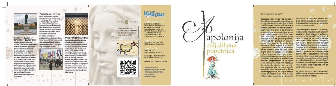
Zloženkna Apolonijina pot v slovenskem, nemškem in angleškem jeziku

Nadaljevali smo s promocijo in trženjem turistične pridobitve oz. produkta: Apolonijina pot. Turistična pot, po kateri se je mogoče peljati z avtomobilom, z avtobusom ali pa s kolesom, je mišljena kot sestavljanka, kjer si obiskovalec iz brošure izbere destinacije, ki jih želi obiskati. Apolonijina pot je turistična destinacija, ki se izjemno dobro uveljavlja na turističnem trgu. Na temo Apolonije so izdelani slamnata lutka, leseni in drugi magneti, maketa/pobarvanka, roll-up, in brošure v slovenskem, nemškem in angleškem jeziku. V urejenem Carinskem parku lik Apolonija krasi igralno hišico. K Apolonijini poti dodajamo vedno nove destinacije. V letu 2021 smo s projektnimi partnerji prijaviili nov projekt, ki bo Apolonijino pot povezal z Veržejem in Ljutomerom.