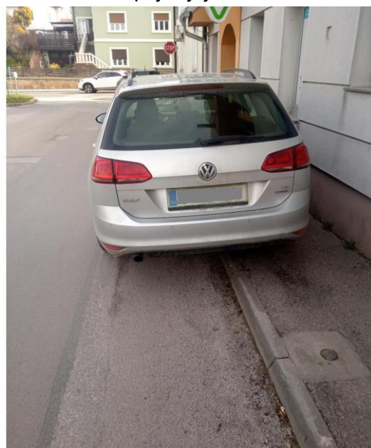
Vozilo parkirano na pločniku

Iz tega področja velja omeniti še problematiko zapuščenih vozil. Namreč v skladu s Zakonom o pravilih cestnega prometa (Uradni list RS, št. 156/21 – uradno prečiščeno besedilo in 161/21 – popr.) je zapuščeno vozilo je motorno ali priklopno vozilo, parkirano na javni cesti ali na nekategorizirani cesti, ki se uporablja za javni cestni promet ali na drugi javni površini, ki ni namenjena prometu vozil in nima registrskih tablic ali ni registrirano več kot 30 dni in ni nerabno ali zavrženo motorno vozilo, ki mu je življenjska doba iztekla zaradi poškodb, starosti ali drugih razlogov in je zaradi tega postal odpadki po merilih iz predpisa, ki ureja ravnanje z odpadki. Teh primerov je bilo v letu 2023, na območju občine Gornja Radgona kar 8, na območju občin Apače 2 in Sveti Jurij ob Ščavnici pa po 1. V primeru, da je takšno vozilo parkirano na neprometni površini ali na zasebnem zemljišču, se obravnava kot nevaren odpadki, kar je v stvarni pristojnosti državne inšpekcije za okolje.