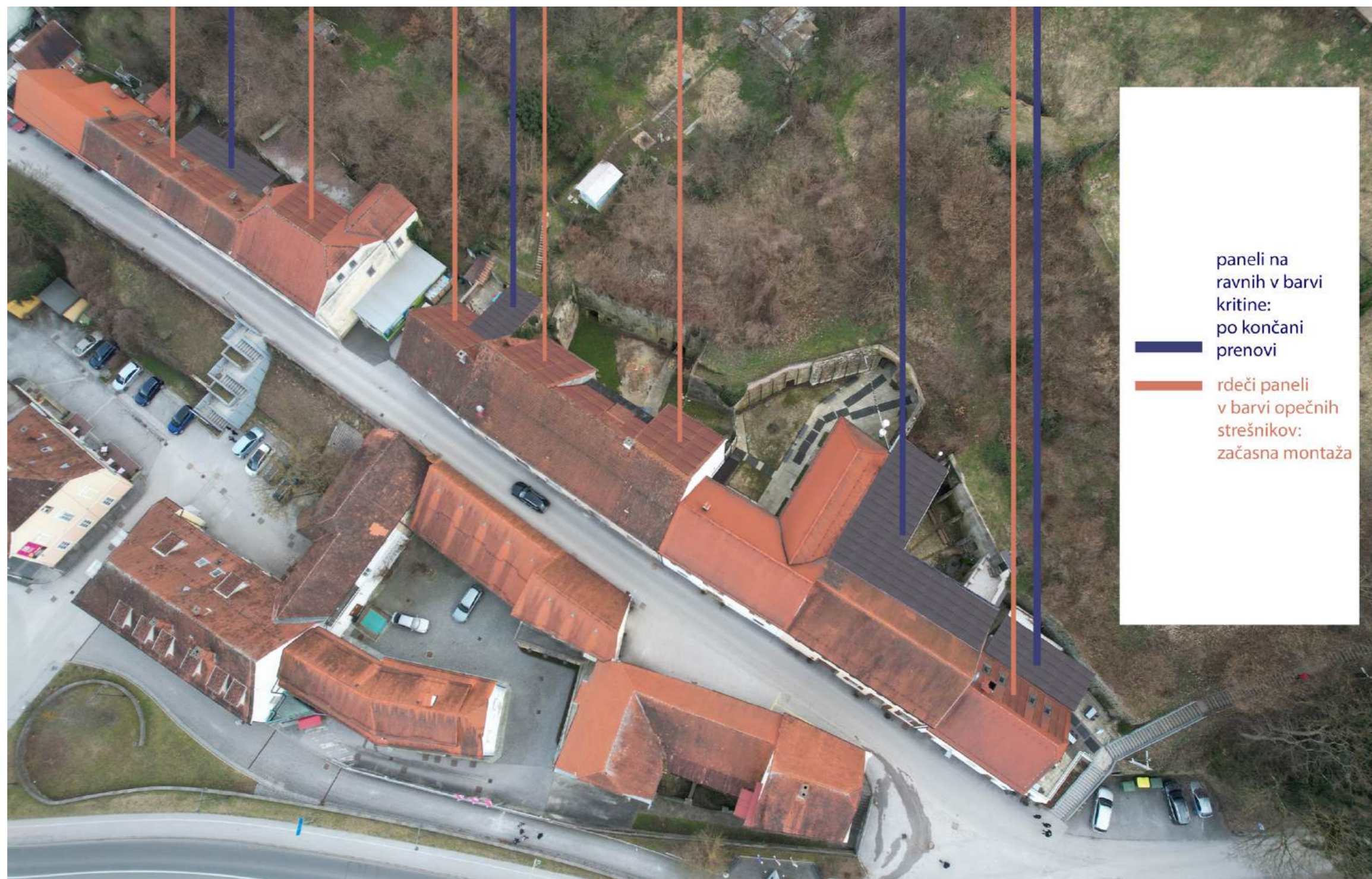
PRINCIP UMEŠČANJA PANELOV NA RAVNE IN POŠEVNE STREŠINE NA STRANI ATRIJEV