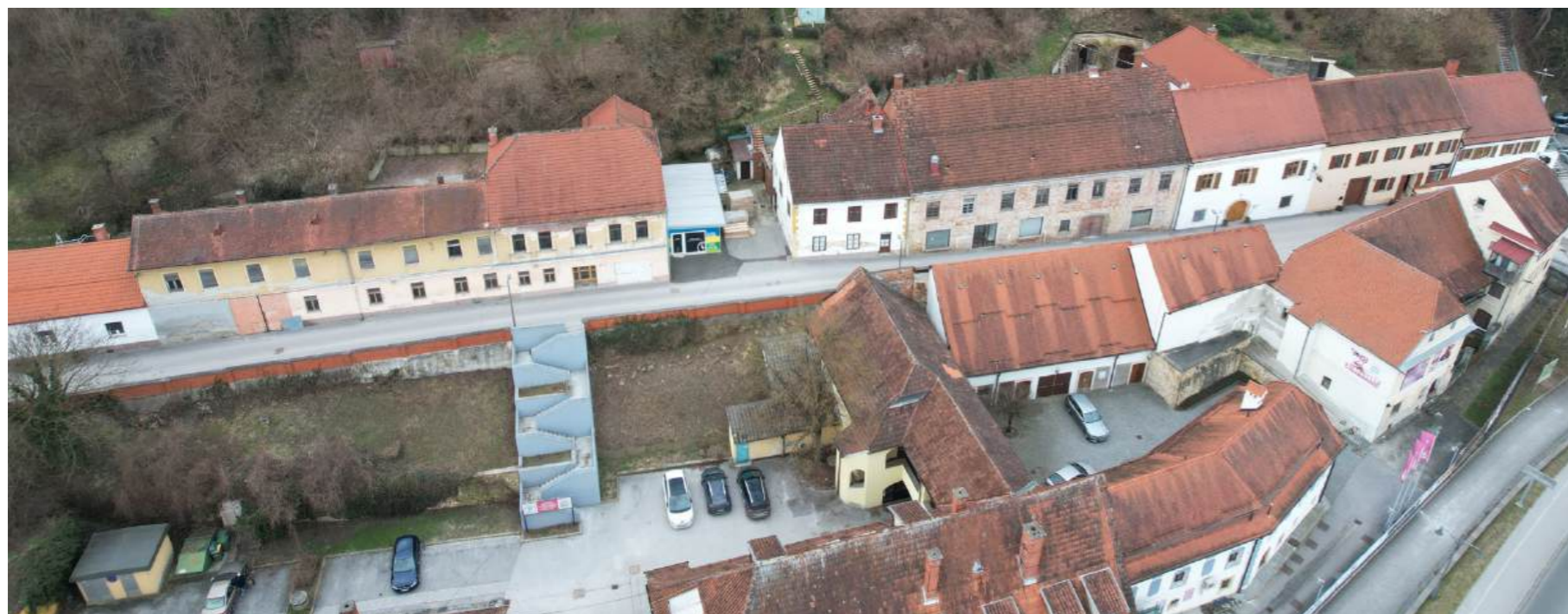
POGLED NA JURKOVIČEVO ULICO Z ZRAKA PO UMESTITVI SONČNIH PANELOV: NI SPREMEMB!