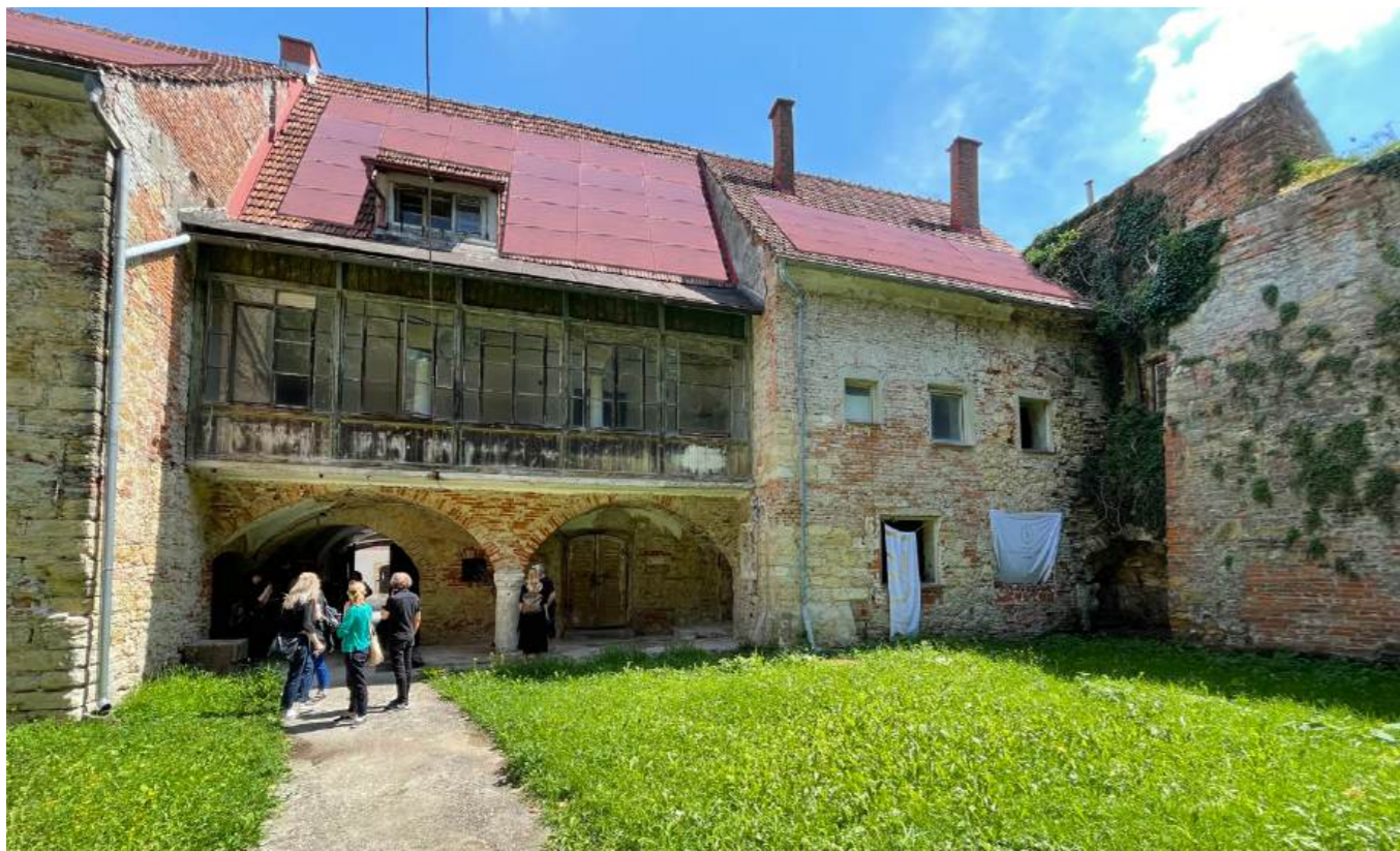
VIZURE NA STREŠINO OBJEKTA GOLAR IZ NOTRANJEGA ATRIJA - PREDVIDENO ZAČASNO STANJE Z UMEŠČENIMI SONČNIMI PANELI

PRIMER ZAČASNEGA UMEŠČANJA NA OPEČNATE STREŠINE NA STRANI ATRIJA