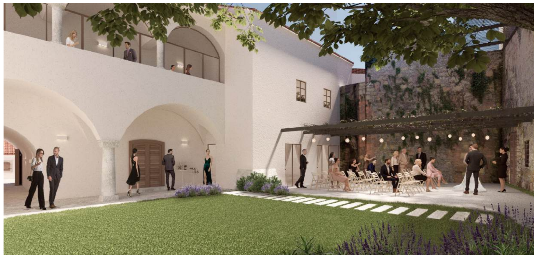
prostorski prikaz - atrij objekta Golar (Jurkovičeva št. 21-23)