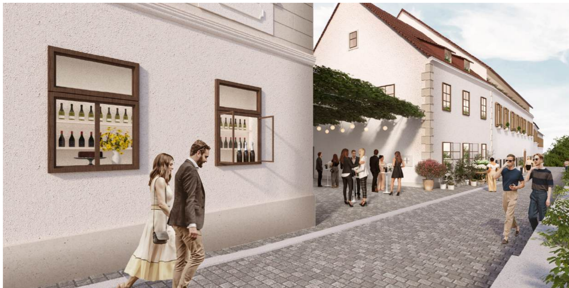
prostorski prikaz - ulica - cvetlični trg med objektoma Suzana in Strmina (Jurkovičeva 17 in 19)