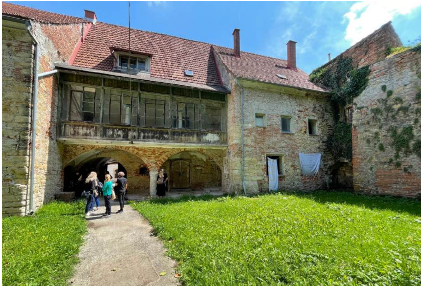
VIZURE NA STREŠINO OBJEKTA GOLAR IZ NOTRANJEGA ATRIJA - OBSTOJEČE STANJE