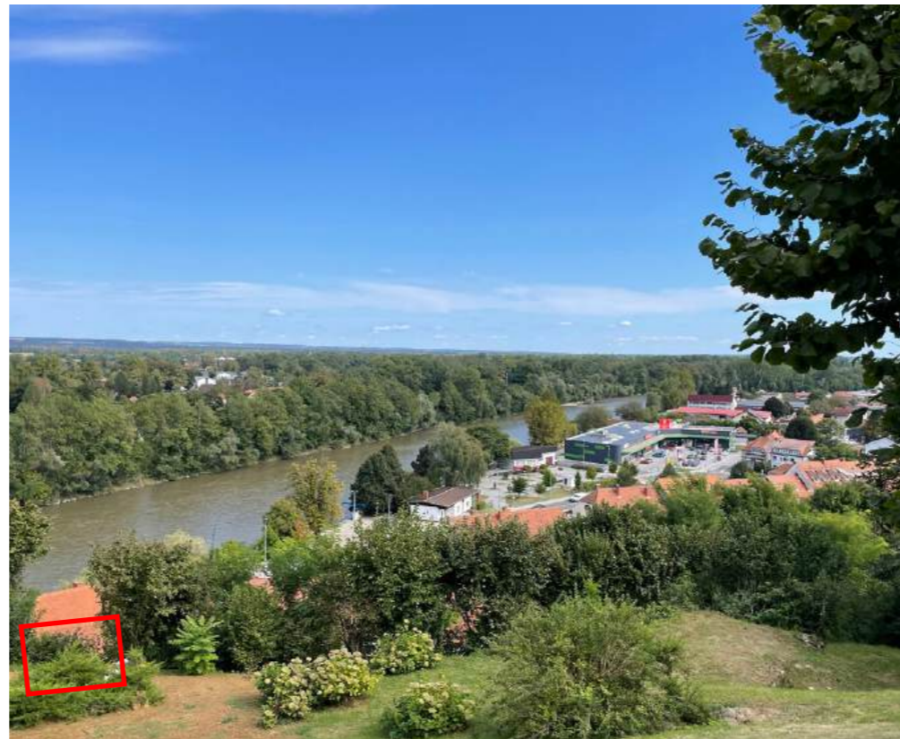
POZ. 2: VIZURE NA SPODNJI GRIS (NI PREDMET PRENOVE) (LEVO SPODAJ KOŠČEK STREHE št.27)