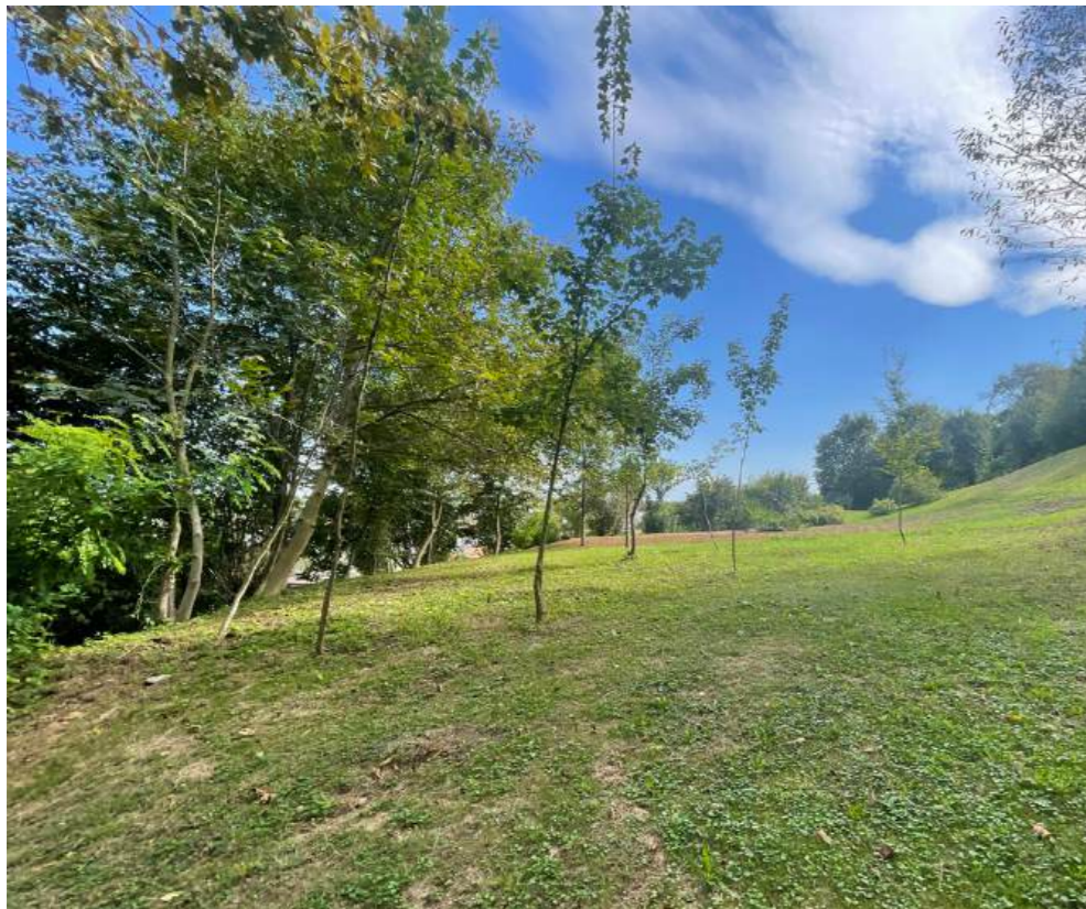
POZ.1: OČIŠČEN PLATO NAD ULICO IN ZELENA BARIERA