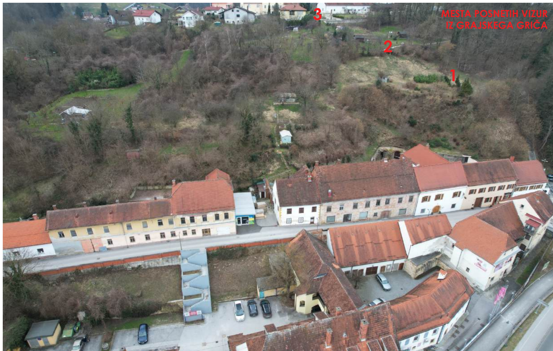
POGLED NA JURKOVIČEVO ULICO Z ZRAKA - PRED UMEŠČANJEM SONČNIH PANELOV