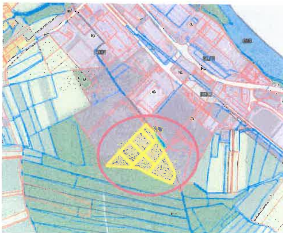
Slika 2: ožji prikaz nepremičnine v naselju Mele

Ožji prikaz lokacije obravnavane nepremičnine in namenska raba prostora: