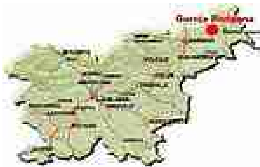
Slika št.3: Občina Gornja Radgona

Območje občine je urejena kmetijska pokrajina, saj je od 128 km 2 ozemlja kar 86 km 2 obdelanih kmetijskih površin in 32 km 2 gozdov, ki pokrivajo severna pobočja gričevnate pokrajine. Obdelane površine so v ravnem svetu ob Muri in dolini reke Ščavnice ter na gričevju v Slovenskih goricah. Po najlepših pobočjih in slemenih teh goric so zasajeni vinogradi, ki vinorodni pokrajini nad Gornjo Radgono dajejo še posebej lep videz.