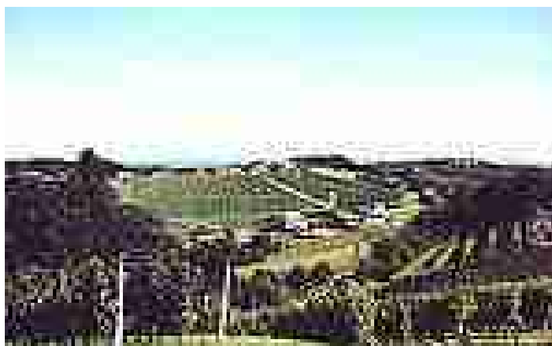
Slika št.4: Občina Gornja Radgona

Občina Gornja Radgona se nahaja na stičišču pomembnih prometnih poti. Dolžina vseh cest v občini znaša 355,47 km, od tega je lokalnih cest 92,796 km, javnih poti 250,634 km in ulic 12,04 km. Dolžina kanalizacije je 16.387 m, dolžina vodovodov pa 77.261 m.