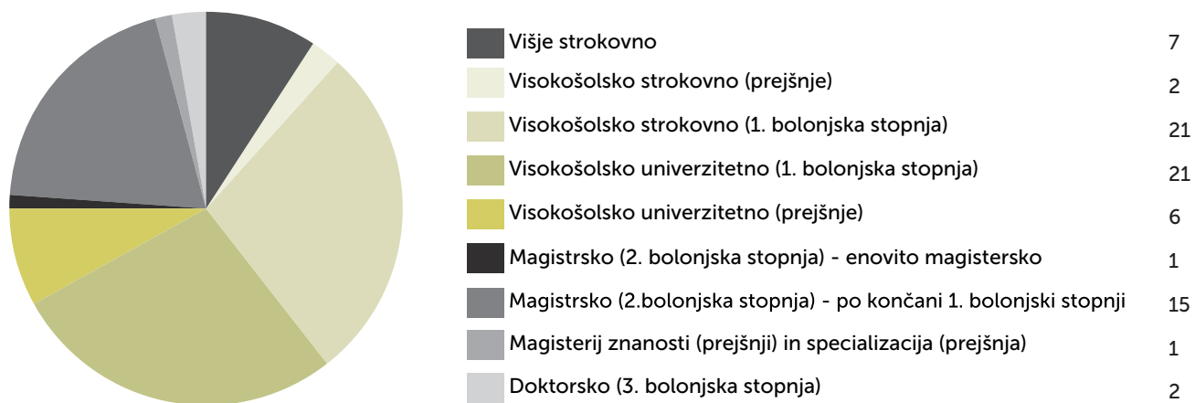
Graf 4. 1: Število diplomantov v letu 2015 glede na vrsto izobraževanja.