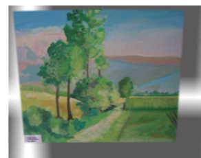
Pokrajina, Franc Baum