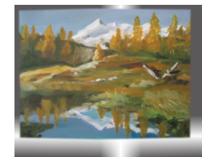
Planine, Zdenka Car