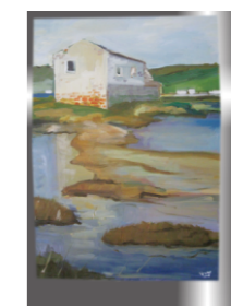
Soline, Vesna Pavrovič