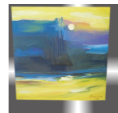
Sončni zahod, Franc Baum