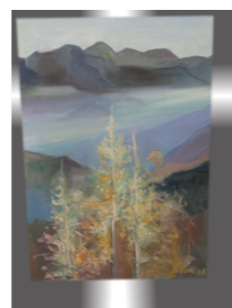
Jesenski motiv, Franc Baum