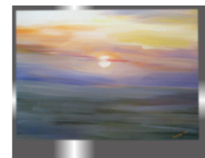
Sončni zahod, Vesna Pavrovič